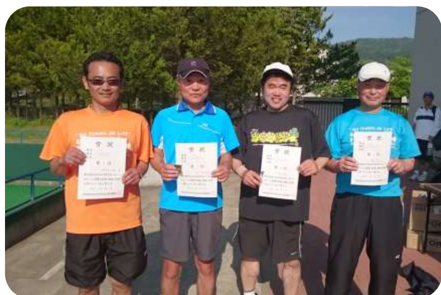
35歳以上男子入賞者