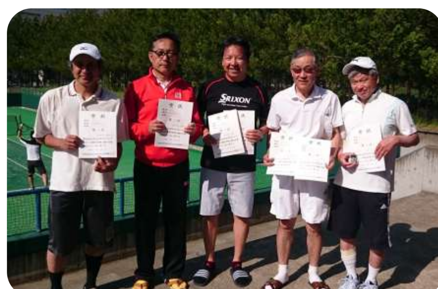
45歳・55歳以上男子入賞者